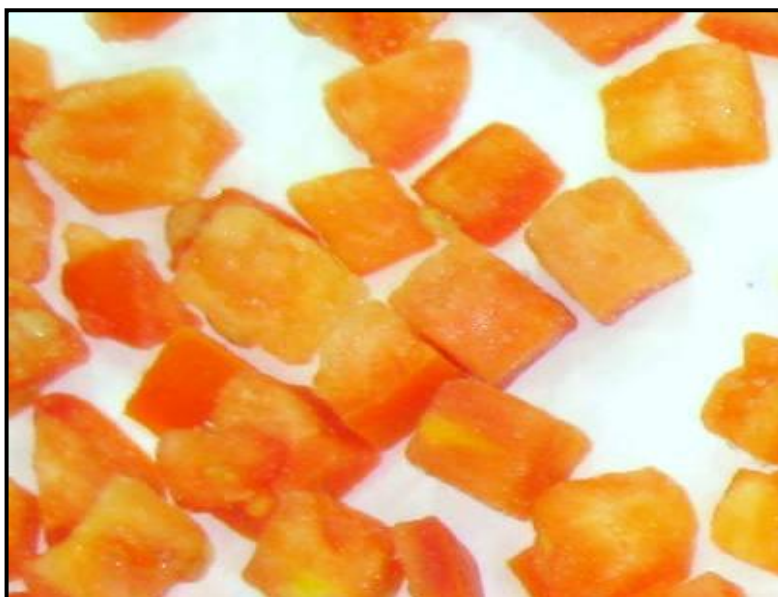
IMAGEN N° 01 UNIDADES PALIDAS